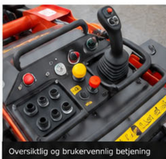
Oversiktlig og brukervennlig betjening