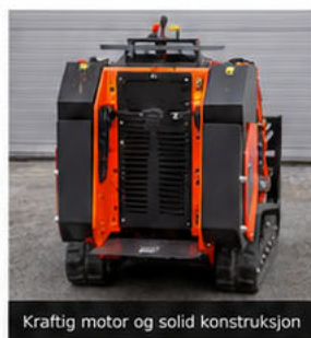
Kraftig motor og solid konstruksjon