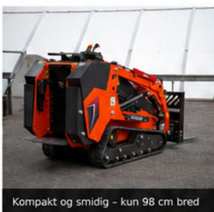
Kompakt og smidig – kun 98 cm bred