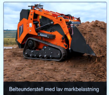
Belteunderstell med lav markbelastning