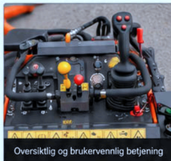
Oversiktlig og brukervennlig betjening