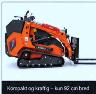
Kompakt og kraftig – kun 92 cm bred